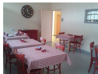
Salle à Manger d'hôtes

Deux animateurs proposent différents ateliers : musique et chant, jeux de société, lecture, gymnastique, atelier mémoire... ainsi que des animations personnalisées.